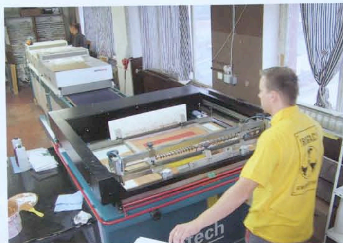
Produktion von Transfers

American Apparel Deutschland GmbH Zollhof 10 40 221 Düsseldorf Tel. +49 (0)211 38 540 90 Fax +49 (0)211 38 540 99 info@americanapparel.de